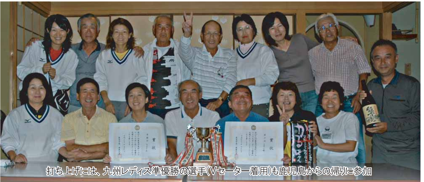
打ち上げには、九州レディース準優勝の選手(Vセーター着用)も鹿児島からの帰りに参加