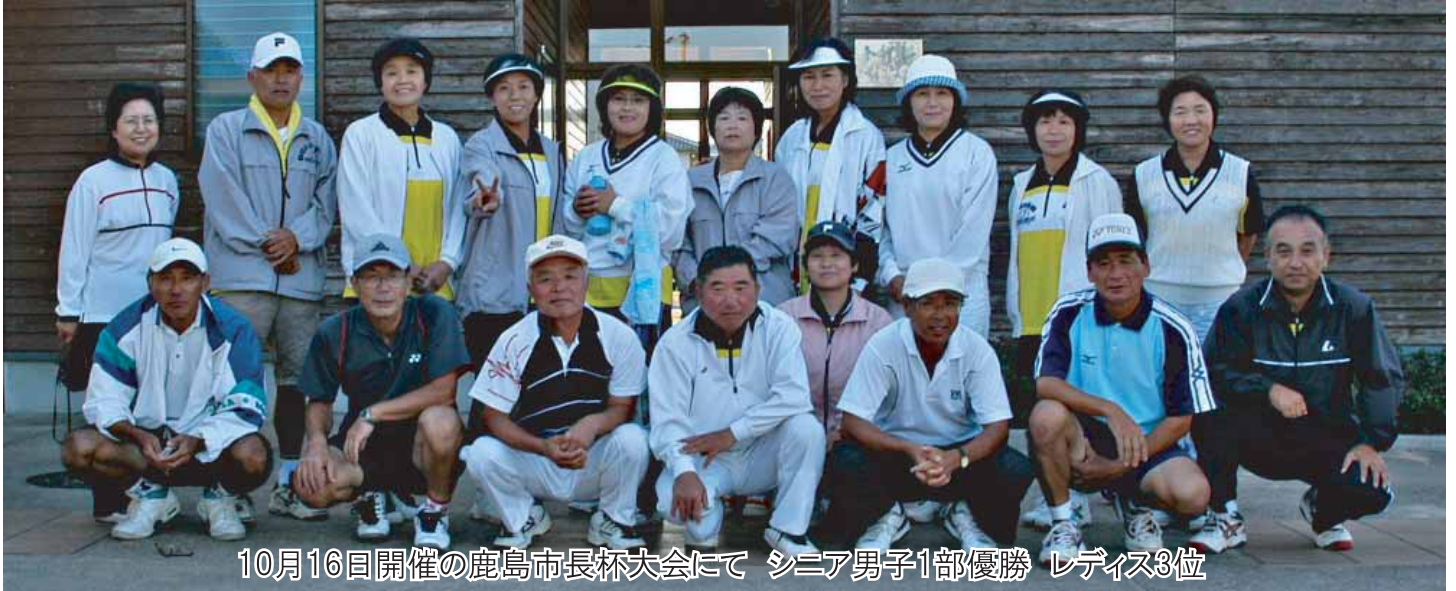
10月16日開催の鹿島市長杯大会にて シニア男子1部優勝 レディース3位